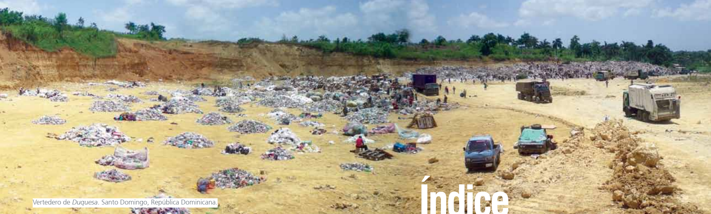
Vertedero de Duquesa . Santo Domingo, República Dominicana.