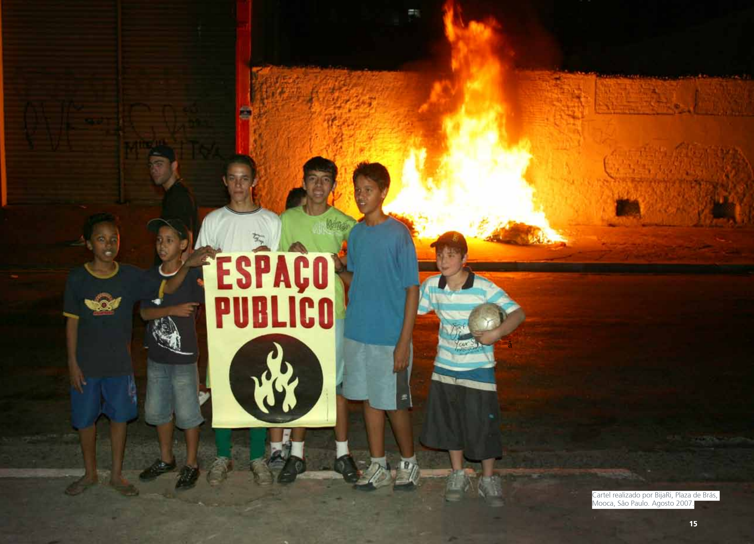
Cartel realizado por BijaRi, Plaza de Brás, Mooca, São Paulo. Agosto 2007.