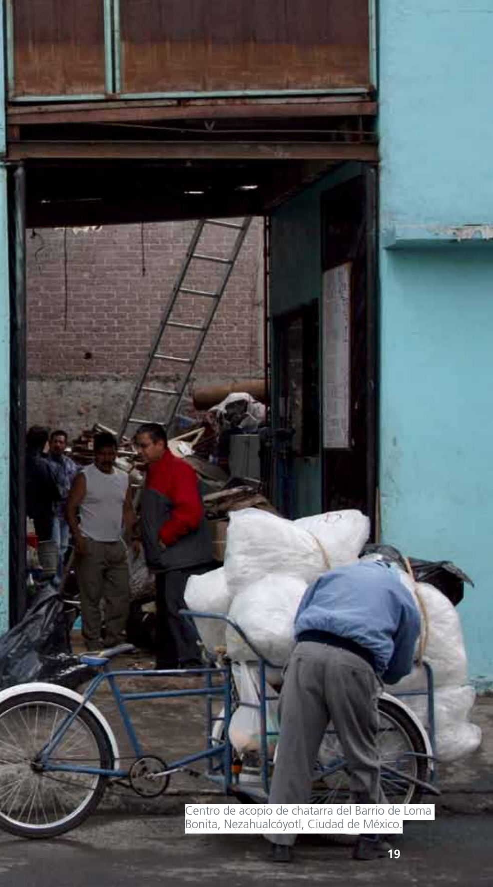
Centro de acopio de chatarra del Barrio de Loma Bonita, Nezahualcóyotl, Ciudad de México.